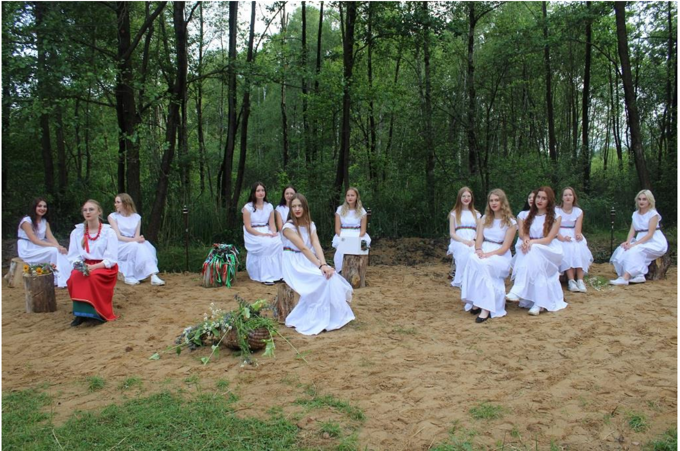
Fot. Obchody nocy świętojańskiej zorganizowane przez KGW Rogowo